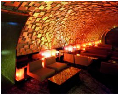
Mise en lumière du Club Silencio, Paris - Oct. 2011