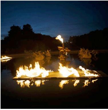
“L’Eau à la Bouche” : installation pour “Versailles Off”. Château de Versailles - Oct. 2006