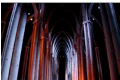
Défilé Thierry Mugler. Paris, mars 2011

Magnifiant le Grand Palais pour sa réouverture, il éblouit près de 500 000 personnes à travers une série d'émotions lumineuses “qui feront rêver les visiteurs”. Dans l'International Herald Tribune, Suzy Menkes commente : « Thierry Dreyfus est l'artiste qui a su habiller la Ville des Lumières à sa juste mesure ».