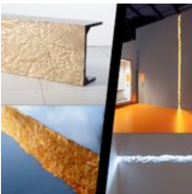
Table « Hommage » (2010) et Élément de Lumière mural « Rupture » (2011)