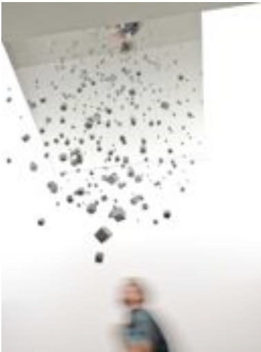
“Nuage I - Offrez-moi votre silence” : suspension exclusive à la Carpenters Workshop Gallery - 2009