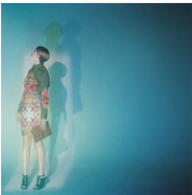
Deux des mises en lumière créées pour la série de mode de Wallpaper* - Paris, Nov. 2011

De collaboration , il est également question, comme pour le très select club parisien "Silencio", dont il compose l'univers lumineux avec et pour David Lynch en octobre 2011, ou pour la mise en place, aux côtés de l'artiste plasticien Moon-Pil Shim, d'installations artistiques permanentes sur des cheminées d'usine, patrimoine emblématique du Nord de la France. Récemment, une rencontre avec l'architecte d'intérieur Peter Marino l'invite à créer des pièces sur-mesure pour un projet parisien.