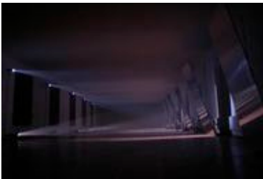
Une des 14 installations réalisées pour le catalogue "Icons" de Louis Vuitton. Paris - 2006