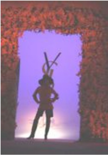
Défilé pour le 40ème anniversaire d'Yves Saint Laurent - Centre Pompidou. Paris - 2002