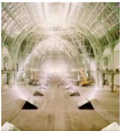
“MR7 Ondes Visibles” : installation pour la réouverture du Grand Palais. Paris - Sep./oct. 2005

Si la lumière compte parmi les éléments les plus impalpables, Thierry Dreyfus parvient à en capter l'essence pour, ensuite, la transmettre et la faire partager. Il expérimente avec la lumière, comme d'autres peignent ou sculptent.